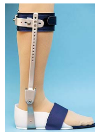
足部シューインサート