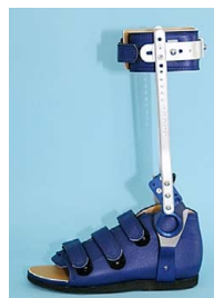
ゲイトソリューション