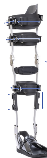
体型に 合わせて 調節可能