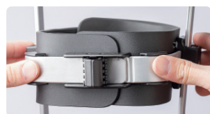
M-Lアジャスト機構(内外幅調整)▶